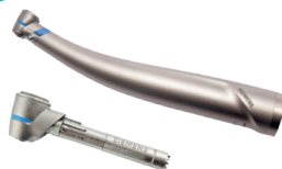
Sirona T1 Titan 80,-€ TE 10/40 - TK 4/6 40,-€