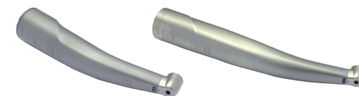
T1 Classic 40,-€

Benötigte Ersatzteile werden gesondert berechnet.