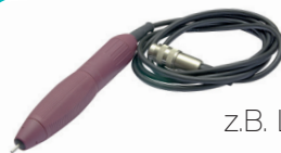
Labongeräte z.B. Laborhandstücke 40,-€